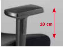
Armlehnen Nr. 122 2F, PP-Auflagen (Nr. 123: PU-Auflagen)

Armrests No. 122 2F, PP armpads (No. 123: PU armpads)