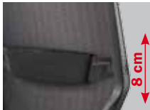
Höhenverstellbare Lumbalstütze (8 cm), gepolstert mit schwarzem Bezugsstoff ( Code 06 )

Three-position seat-tilt adjustment (-3°/6°/0°), optionally for Syncro®-Tension ( code 10 )