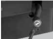
Sitzneigeverstellung dreistufig (3°/6°/0°), optional für Syncro®- Tension ( Code 10 )

Seat-depth adjustment using sliding seat (6 cm), can be locked in 6 positions (Model number SH xxxx5 )