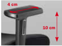
Armlehnen Nr. 125* 3F, PU-Auflagen

Armrests No. 122 2F, PP armpads (No. 123: PU armpads)