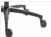
Fußkreuz Typ H Kunststoff schwarz (Standard)