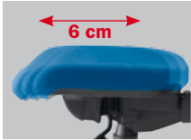
Sitztiefeverstellung mittels Schiebesitz (6 cm), 6fach arretierbar (Modell- nummer SH xxxx5 )

Seat-depth adjustment using sliding seat (6 cm), can be locked in 6 positions (Model number SH xxxx5 )