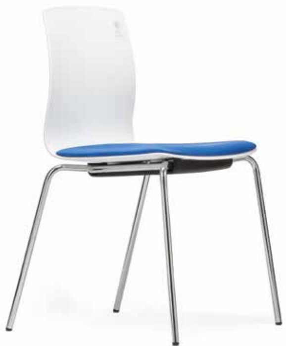
FI 7510_MCS 8-fach stapelbar | stackable up to 8-high