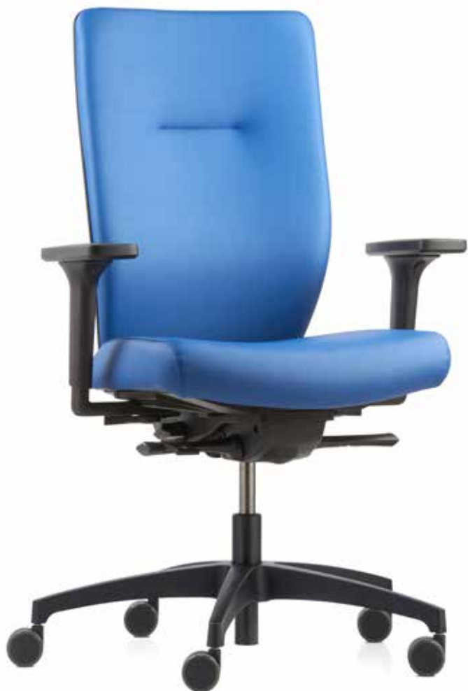
QS ST 6855 ES operator + Armlehnen | Armrests A348KGS MicroSilver

Stilo swivel chairs are reliable partners in the office, tailored to your individual needs as a user. The high-quality Silvertex® upholstery covers are permanently antimicrobial and easy to clean. Pleasant soft armrest pads with MicroSilver BG™ additives support the protection against infections. The best seating comfort and hygiene in the workplace are guaranteed.