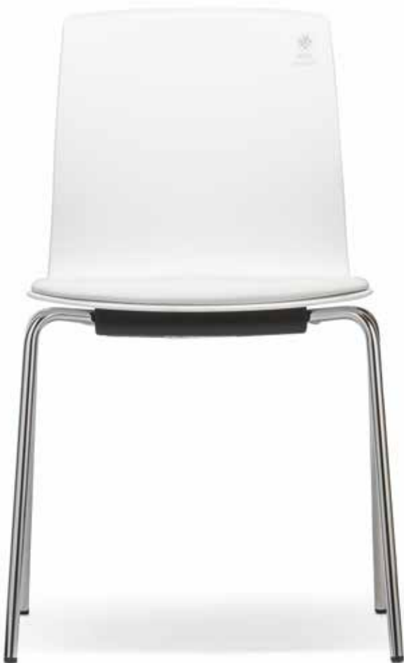
FI 7510_MCS 8-fach stapelbar | stackable up to 8-high

Invisible protection against invisible enemies. The white plastic shell contains an ingenious secret weapon, namely the antimicrobial MicroSilver BG™ finish which kills bacteria with the continuous release of silver ions. Fiore MicroSilver models can also be equipped with upholstery or fully upholstered covers made of antimicrobial Silvertex® vinyl.