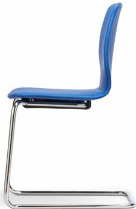
FI 7516_MCS 4-fach stapelbar | stackable up to 4-high