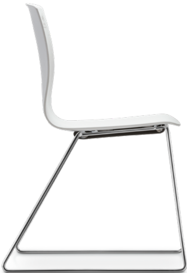
FI 7500_MCS 8-fach stapelbar | stackable up to 8-high