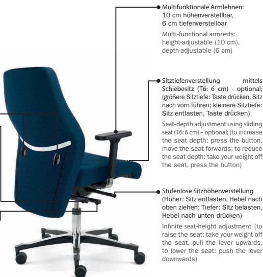
(Abb./ Ill.: IS 1958 ST T6 A207APO)

Weitere Informationen finden Sie unter:/ For further information please contact: www.dauphin-group.com