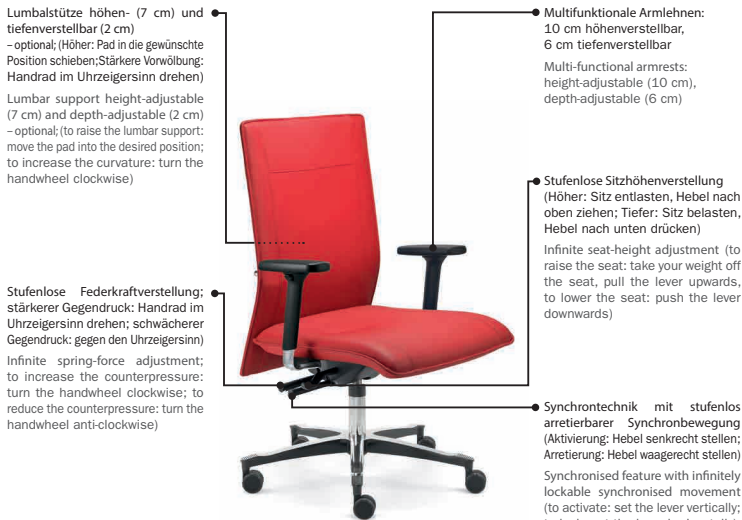
(Abb./ Ill.: MM 0783 ST A217APO)

Weitere Informationen finden Sie unter:/ For further information please contact: www.dauphin-group.com