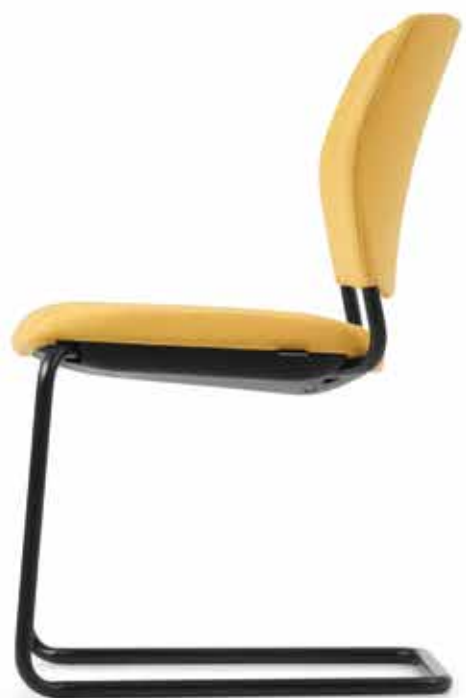
CY 0476 (4fach stapelbar | stackable up to 4-high)