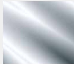
GSCR Verchromt (Option) Chrome (Option)