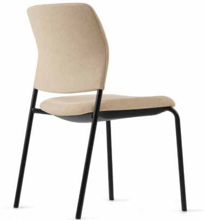
CY 0470 (4fach stapelbar | stackable up to 4-high)

The color black brings structure, order and depth into bright rooms and creates interesting contrasts. The Cay four-legged chairs and cantilevers with their black frames and full upholstery in soft, harmonious fabric tones look modern and individual at the same time.