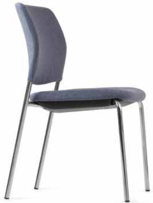
CY 0470 (4fach stapelbar | stackable up to 4-high)