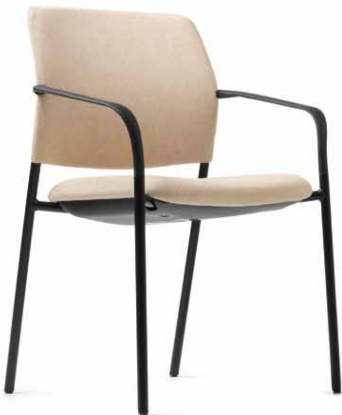
CY 0470 Kunststoff-Armlehnen, nicht nachrüstbar | Plastic armrests, not retrofittable AB05KGS (4fach stapelbar | stackable up to 4-high)