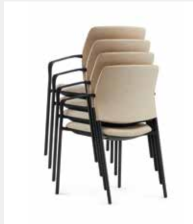
Vierbeiner ohne/ mit Armlehnen 4fach stapelbar Four-legged chair without/with armrests, stackable up to 4-high