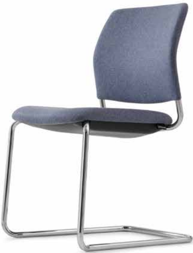
CY 0476 (4fach stapelbar | stackable up to 4-high)

Cay is always comfortable, functional and presents a clear design without being obtrusive. Thanks to their ability to stack them four high, the cantilever chairs and four-legged models can be stored away and save space. The durable, chrome frames are particularly well suited for this purpose.