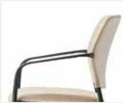
AB05KGS Kunststoff-Armlehnen, nicht nachrüstbar Plastic armrests, not retrofittable