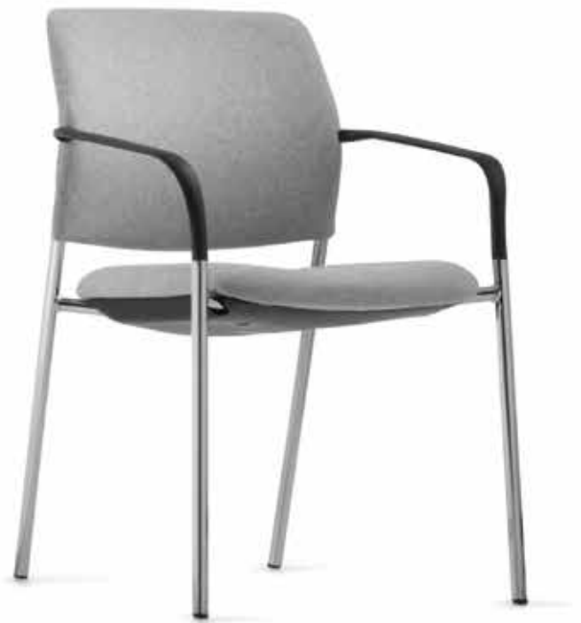
CY 0476 Kunststoff-Armlehnen, nicht nachrüstbar | Plastic armrests, not retrofittable AB05KGS (4fach stapelbar | stackable up to 4-high)