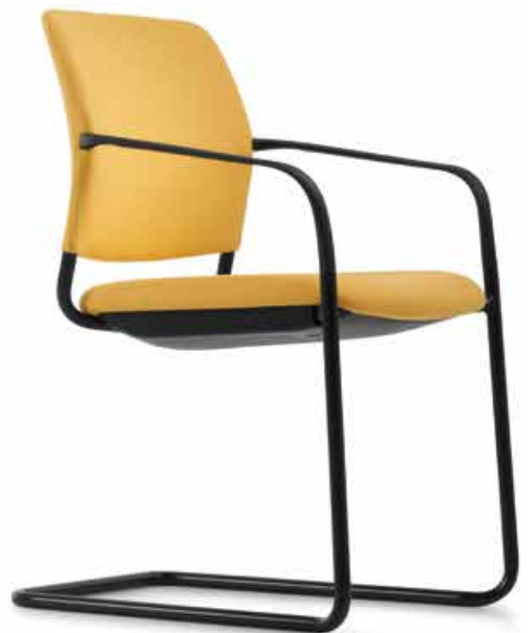
CY 0476 Kunststoff-Armlehnen, nicht nachrüstbar | Plastic armrests, not retrofittable AB05KGS (4fach stapelbar | stackable up to 4-high)