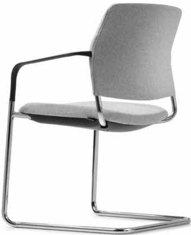
CY 0476 Kunststoff-Armlehnen, nicht nachrüstbar | Plastic armrests, not retrofittable AB05KGS (4fach stapelbar | stackable up to 4-high)