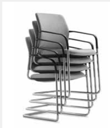
Freischwinger ohne/ mit Armlehnen 4fach stapelbar Cantilever without/ with armrests, stackable up to 4-high